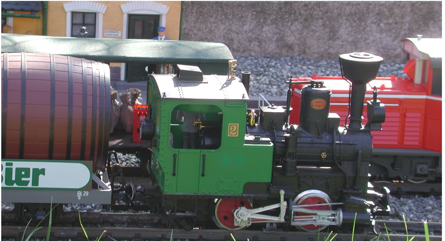
Stainz mit Fasslwagen, 2091 und beladener „Stubaitaler“ Anlage O. Zoffi