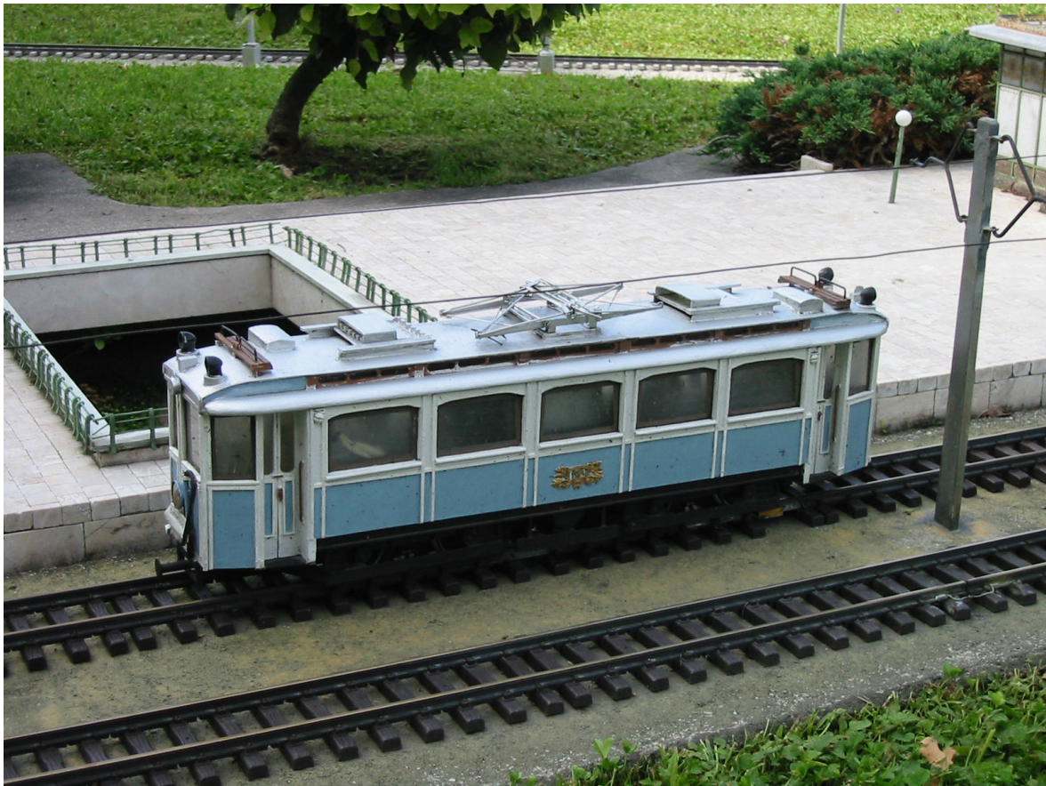
Triebwagen der Badnerbahn auf der Anlage von Minimundus