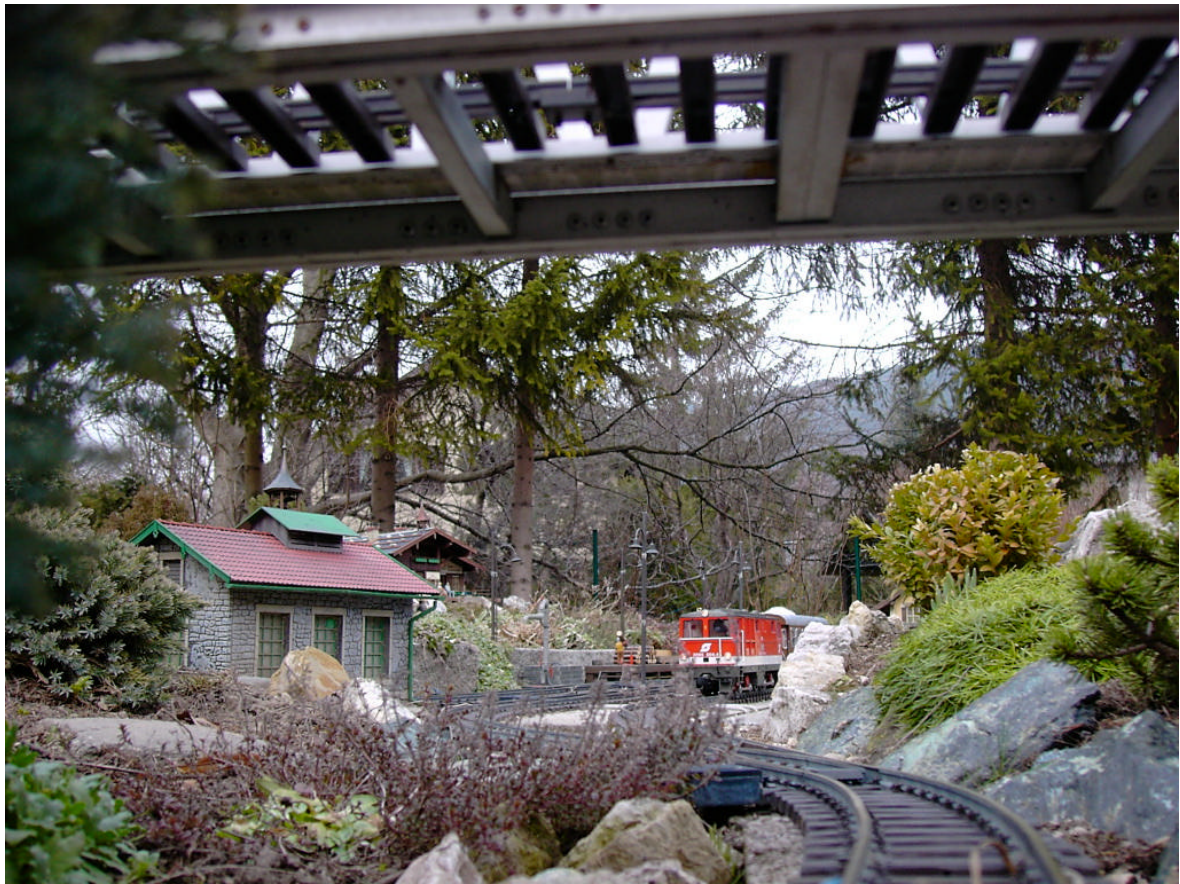
2095 auf der Anlage Nistelberger [Bild: Wilhelm Danzinger]