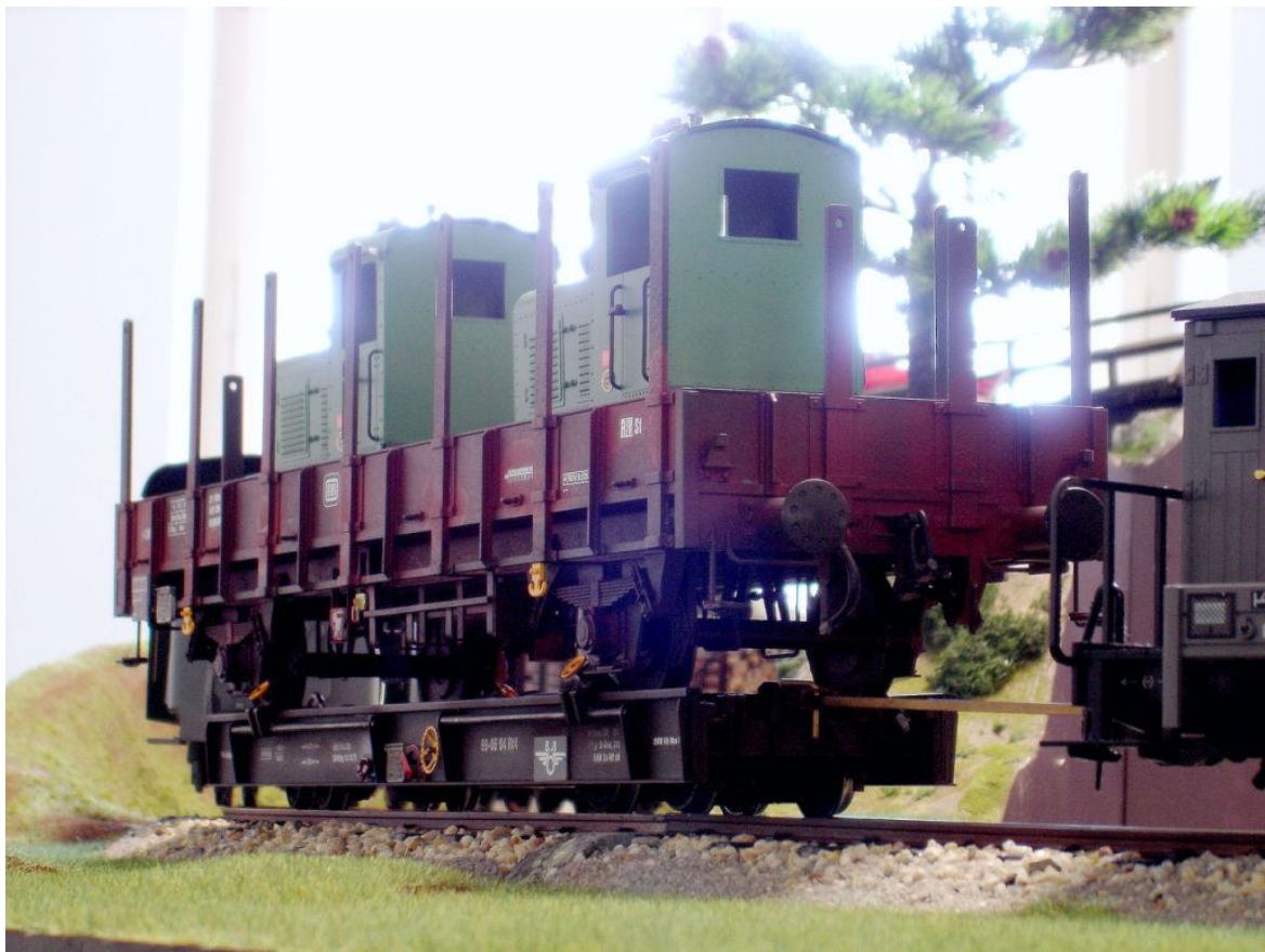
Aufgeschemmelter Spur II Regelspurwagen