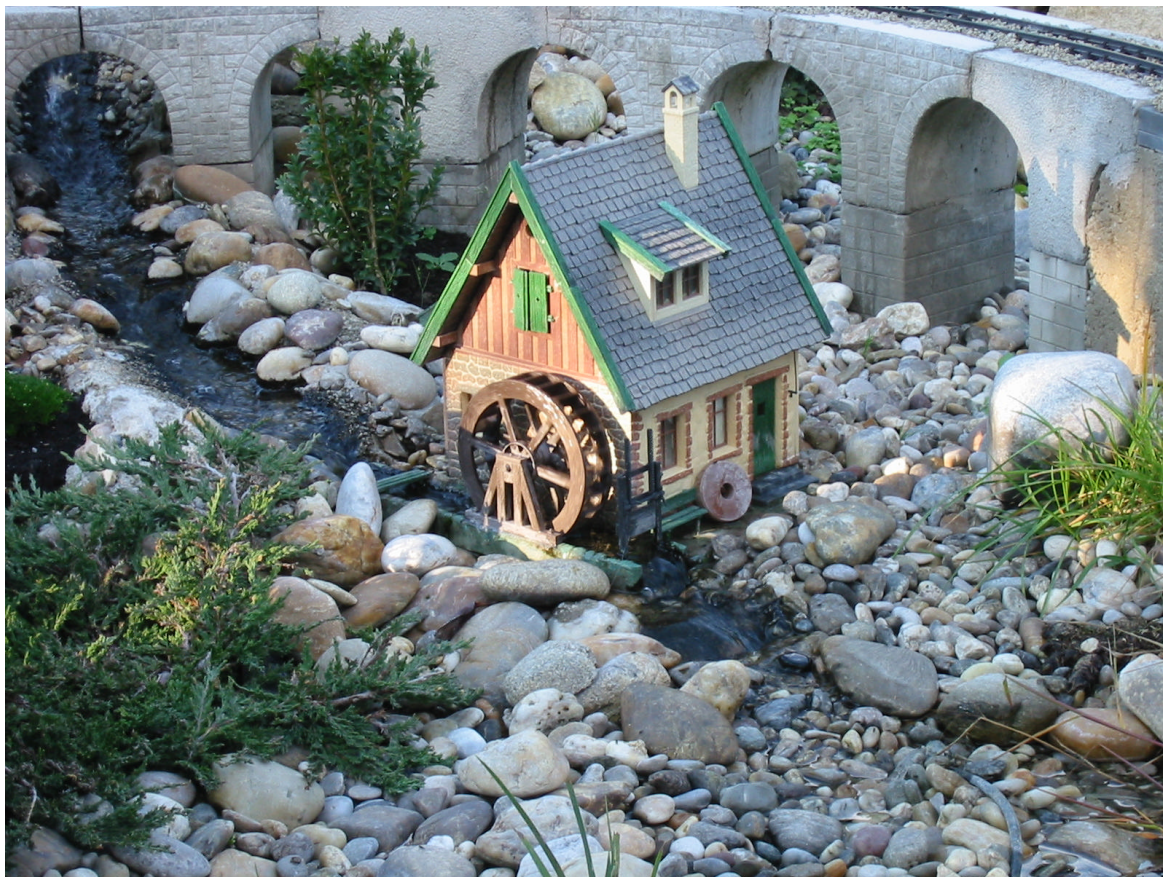
Detail auf einer Anlage in Langenzersdorf