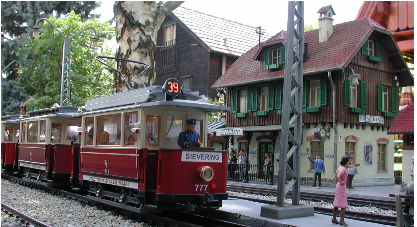
39er auf der „Sieveringer“ Anlage in Wien