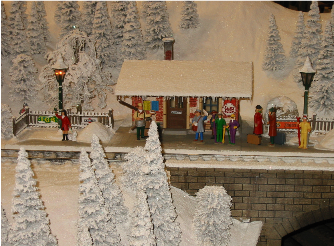
Detail der LGB Winter - Schauanlage