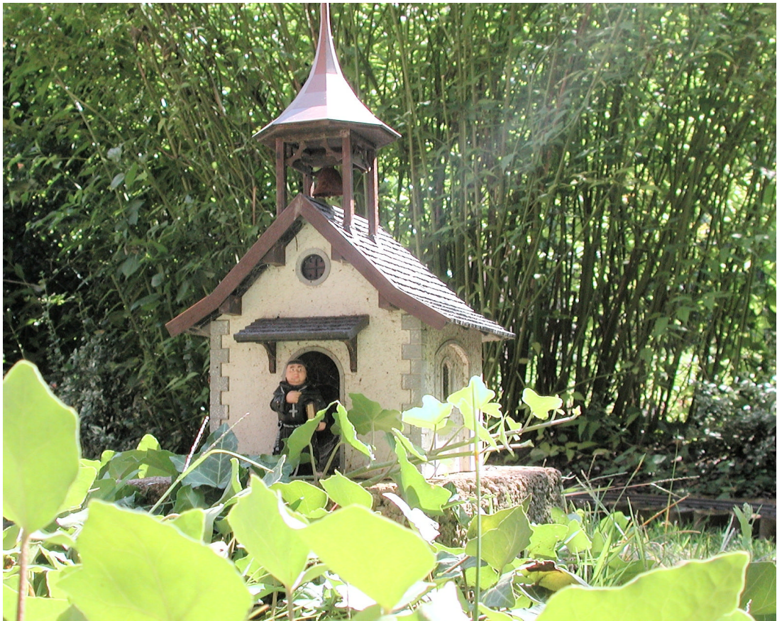
Detail der „Sieveringer“ Anlage in Wien