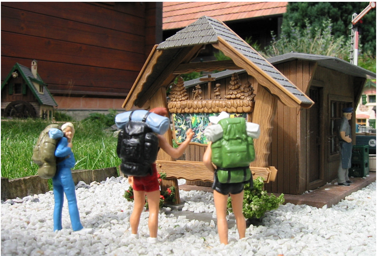
Detail auf der „Sieveringer“ Anlage in Wien