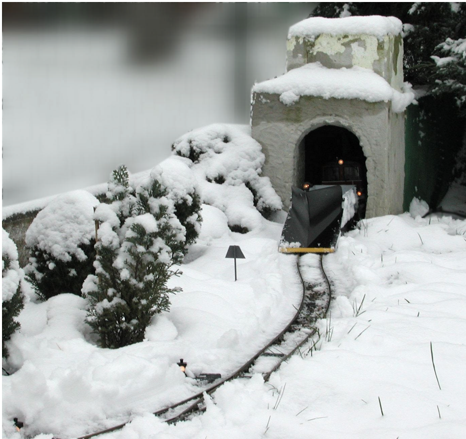
Anlage O. Zoffi Schneepflug